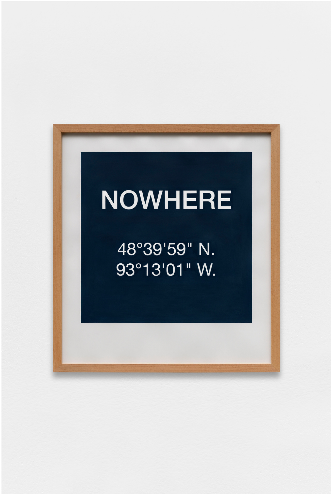
Nowhere , 2018 peinture acrylique sur papier 65 x 50 cm