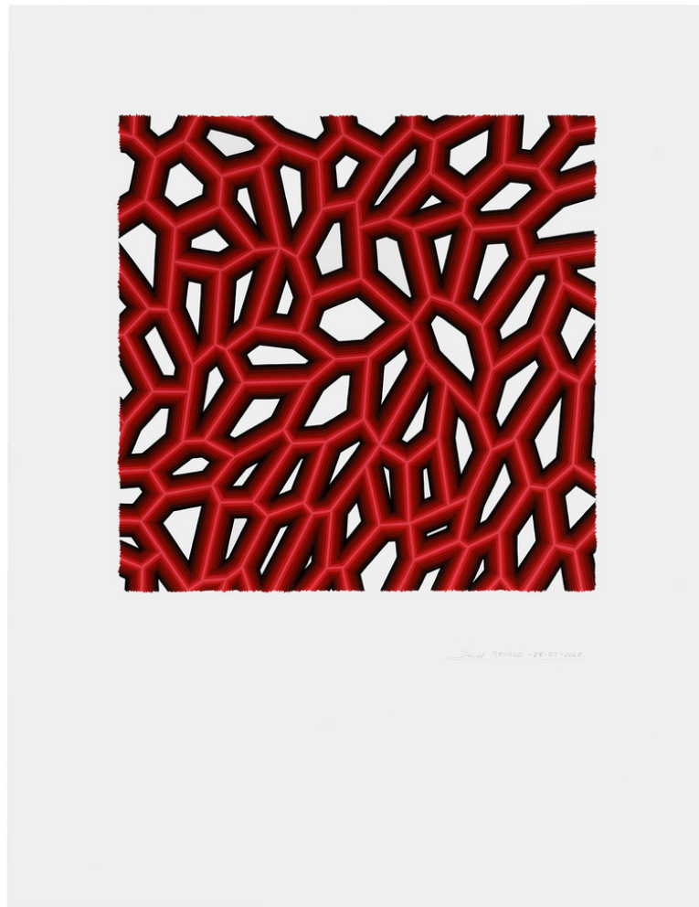
Sans titre , 2020 peinture acrylique sur papier 65 x 50 cm