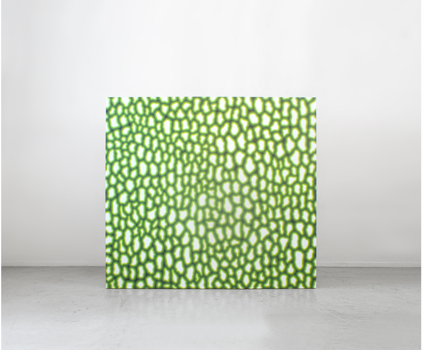
Recall , 2016 peinture acrylique sur contreplaqué, bois et équerres métalliques 220 x 240 x 56 cm